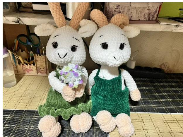
«Кәҗә белән сарык»

Бу кул эшләренә Г.Тукай әсәрләре сайлануы очраклы гына түгел. Бу елны бөек шагыйребезнең тууына 140 ел тула. Алда тагын да кызыктырак проектлар булып ышанабыз. Газетабызның алдагы саннарында тәкъдим итәсе эшләребезнең давамыйн көтегез.